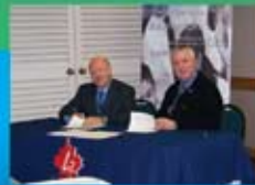
Signature du partenariat avec l'Institut des langues officielles et du bilinguisme, Université d'Ottawa, novembre 2007