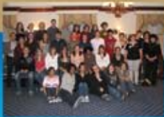
Forum national SEVEC/ ACPLS sur la dualité linguistique chez les enseignants et les jeunes, Gatineau, novembre 2007