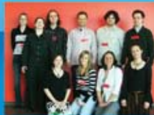
Congrès des enseignants de l'ALS SPEAQ/ACPLS, Université du Québec en Abitibi- Témiscamingue, mars 2008