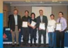
Panel médiatique, Journée de l'Association de l'ACPLS, décembre 2007