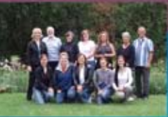
Formation des enseignants du français intensif à Toronto, juin 2007

L'Association canadienne des professeurs de langues secondes