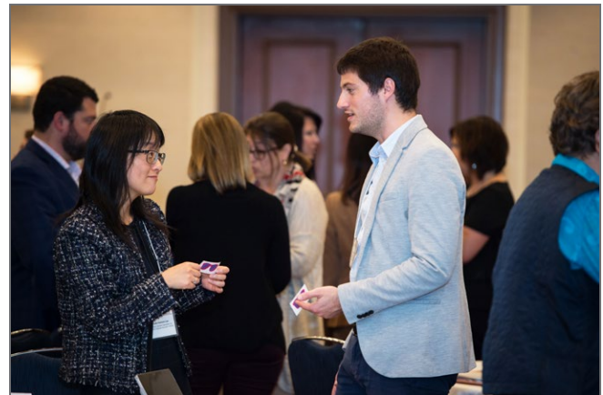
Une activité dans le cadre de l'atelier sur le Portfolio des langues et l'autonomie de l'apprenant