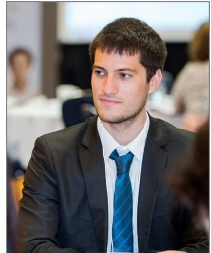
Par Samuel Coeytaux Chargé de mission – Coopération éducative, Ambassade de France au Canada

SJ : Oui. Depuis le début de ma carrière, j'essaie de tout avoir en format numérique. Ma première école était une école pilote pour les Google Apps pour l'éducation , et